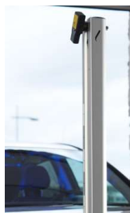
Laserpointer | Alu-Säule 180cm