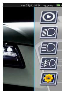
Dual-Modus | Software S2600