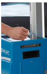
Touchscreen | Ports: USB, RS232, RJ45

CAP2600EX-W CAP2600EX-WW CAP2600EX-WIW CAP2600EX-S CAP2600EX-SW CAP2600EX-R