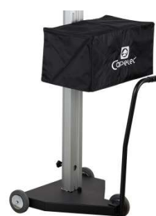
Fuß auf Rollen | Option: Schutz- abdeckung und Transportgriff