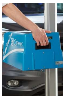
Handgriff | Positionierungshilfe