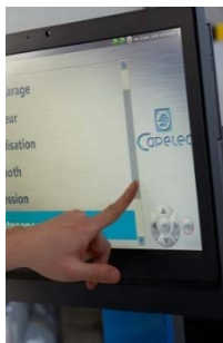
Ecran tactile Logiciel S3600