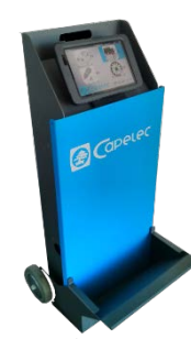
CAP3500-WORKSHOP Station transportable