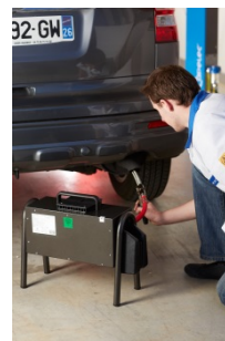
CAP3030 Cellule d'opacité