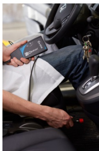
CAP8520 Compte tour