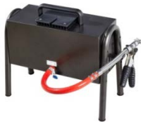
CAP3600-WORKSHOP Station fixe ou mobile avec grand écran tactile